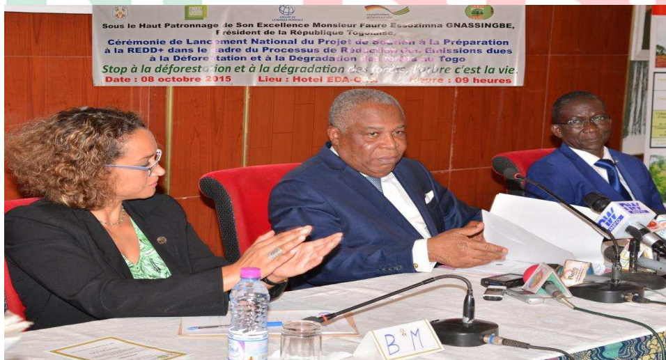
La table d'honneur lors de la cérémonie de lancement