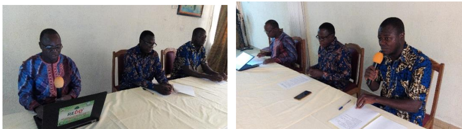
Le Coordonnateur national adjoint lors de son intervention Le CTN /GIZ, lors de son intervention

les travaux de cet atelier de deux jours pour les acteurs de la filière bois des régions Savanes, Kara et Centrale.