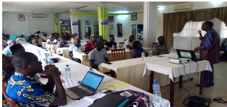
Le coordonnateur national adjoint (micro en main, répondant aux questions des participants) à la suite des communications

Toutes ces présentations ont fait l'objet de très riches et fructueux débats qui ont permis aux participants de comprendre mieux le processus et les défis qu'il faut surmonter. Les principales questions et les réponses subséquentes sont consignées dans le tableau 1 relatif à la synthèse des débats.