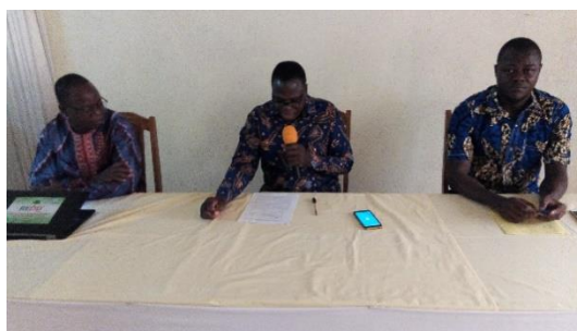
Le SG SYTREBACT, lors de son mot d'ouverture

Après la cérémonie d'ouverture de l'atelier, un bureau a été mis en place pour conduire les travaux de l'atelier. Ce bureau est composé de trois (03) membres : un président et deux rapporteurs :