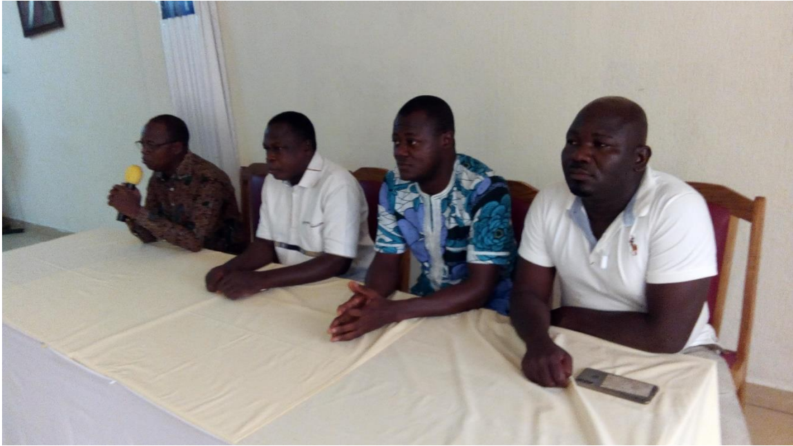
Le coordonnateur national adjoint (portant le micro 1 er à gauche) remerciant les participant lors de la cérémonie de clôture des travaux de l'atelier